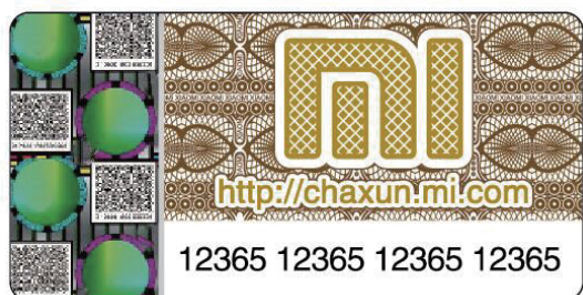
Наклейка со стертым защитным слоем